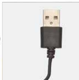
2. ga povežete z USB adapterjem: adapter mobilnega telefona, power bank, računalnik