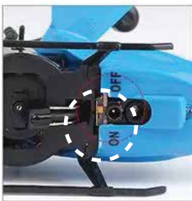
1. prestavite stikalo na ON