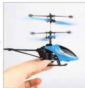
3. nežno spustite v let