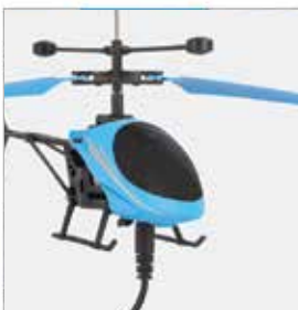
1. priključite kabel