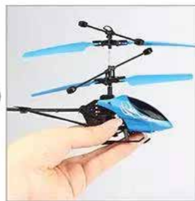
2. pridržite 2-3 sekunde